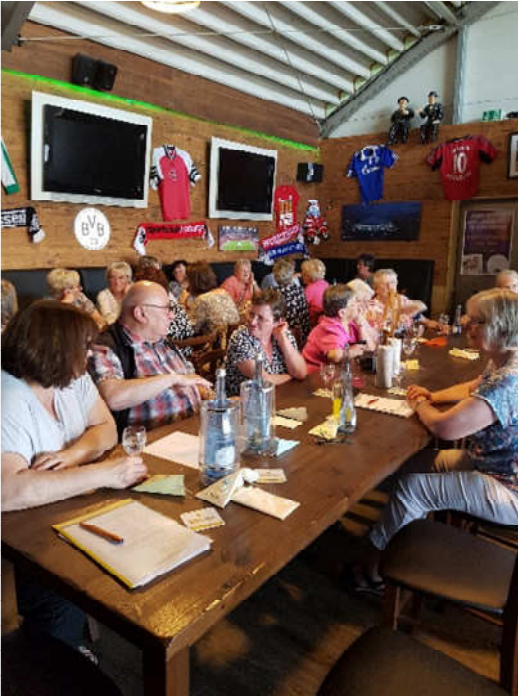
Die Mitglieder der Frauengemeinschaft Kirchwald in der Arena

Nachdem sich die Mitglieder zum Abschluss mit einem leckeren Abendessen gestärkt hatten gingen alle nach einem schönen Nachmittag nach Hause.