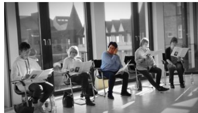
Unser Kirchenchor an einem Probewochenende

Werden Sie musikalischer Unterstützer im Förderverein!